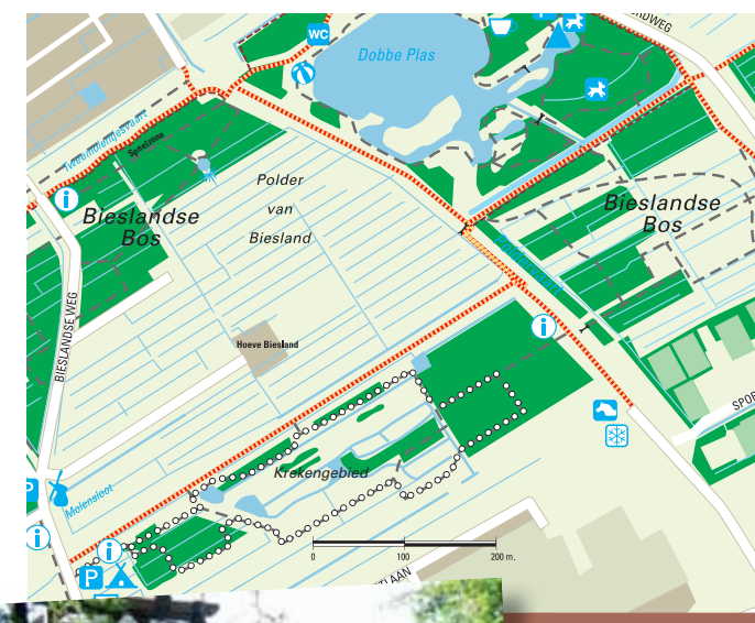
Het Bieslandse Bos

Het Bieslandse Bos is erg afwisselend. Er is dicht bos, maar het gebied biedt ook mooie oud Hollandse vergezichten. Bij de Ronde Vijver kijkt u uit over een karakteristieke, traditionele Zuid-Hollandse polder, die in 1780 is drooggemalen. De molen zonder wieken aan de Noordeindseweg is een overblijfsel uit die tijd. Het moerassige 'Kreekengebied' biedt een veel opener en meer ruige aanblik. Hier vinden vele vogels en insecten hun voedsel en beschutting in struiken, zoals vlier, sleedoorn, roos, braam en hazelaar. Op en rond het water ziet u vele soorten eenden, ganzen en in de zomer ook lepelaars. Een vaste wintergast is de smient, een kleine eend met opvallende gele streep op het voorhoofd. Deze bijzondere eend maakt een hoog fluitend geluid dat u gemakkelijk kunt herkennen.